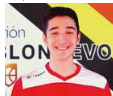
Base Gonzalo Orozco Domínguez