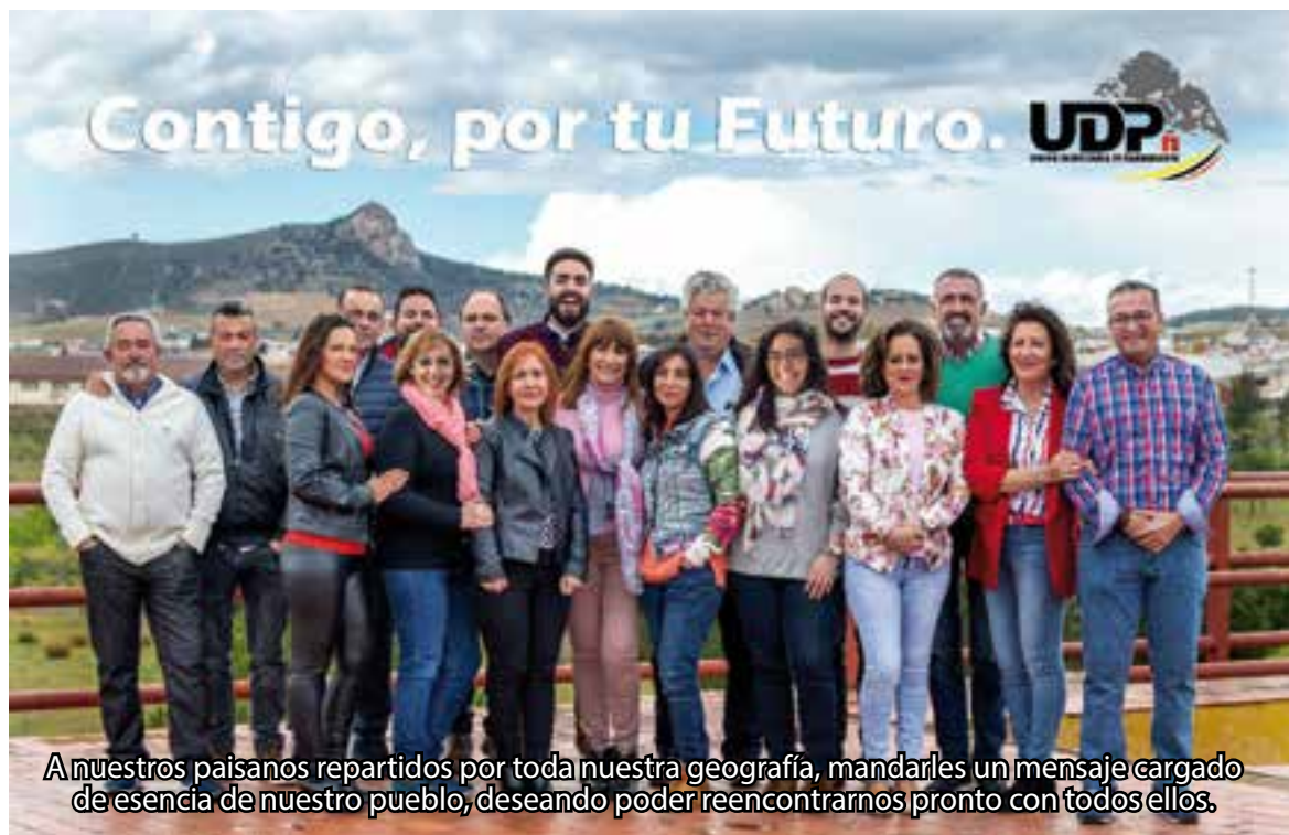
A nuestros paisanos repartidos por toda nuestra geografía, mandarles un mensaje cargado de esencia de nuestro pueblo, deseando poder reencontrarnos pronto con todos ellos.

A todos los ciudadanos de Peñarroya-Pueblonuevo gracias por vuestro ejemplo y positividad. No nos olvidemos que debemos seguir cumpliendo las medidas para que nuestro ejemplo sea el espejo en el que se reflejen las futuras generaciones.