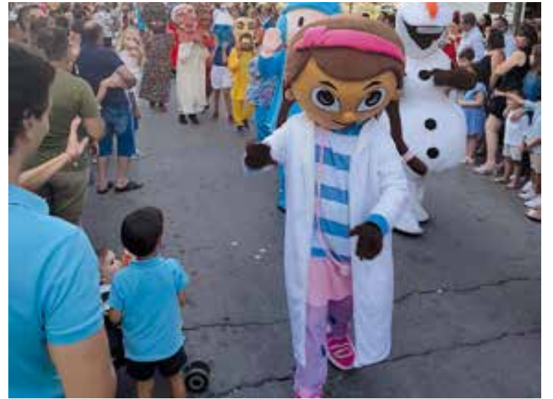
Pasacalles de la último año en el que se celebró la feria

Por último, el regidor puntualizó que "si a todo esto le sumamos las nuevas normas aprobadas por la Junta de Andalucía el pasado 22 de julio en el BOJA por las que se recomienda la no celebración de ningún tipo de fiestas, feria o festejos y ante la aglomeración de personas, entendemos que es la decisión correcta en estos momentos".