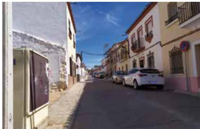
La calle Castelar es una de las zonas en las que se va a actuar

Respecto a la reforma que se va a ejecutar en varios tramos de callejón de servicios de la calle San Miguel, va a contar con un presupuesto total de 56.878,28 euros, de los cuales 23.251,51 euros se destinarán a materiales de obra. Los restantes 33.626,77 euros se destinan al pago de mano de obra, y va a