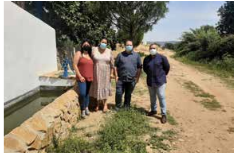
Morales y Amo visitando una de las zonas en las que se ha actuado

Por otra parte, la vicepresidenta primera se interesó por otras intervenciones realizadas en el municipio con cargo a planes de la institución. Así, visitó las obras realizadas