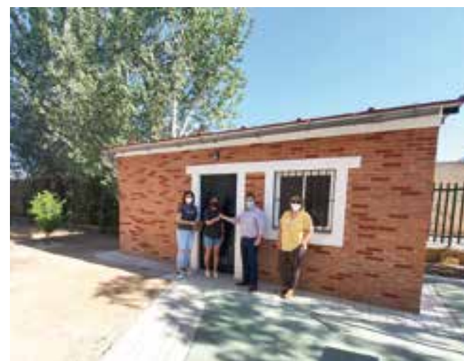
Espacio en el que se ha actuado en el colegio San José de Calasanz