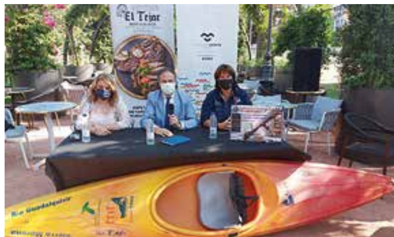
Acto de presentación de esta actividad