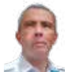
Daniel García Gallardo

es, el favor de quien tenía de hecho la potestad de señalar a su sucesor a en la jefatura del Estado español con el título de rey, que recayó sobre Juan Carlos, el mismo que había educado a su conveniencia en España, lejos de "las malas influencias" e ignorando los derechos de otros pretendientes, mientras en sus lúgubros años otorgaba títulos nobiliarios como aquel el de Conde de FENOSA, un magnate de la banca y las eléctricas gallegas ejemplo de la aristocracia franquista. Como a Napoleón Bonaparte, no le habría faltado un papa para consagrar su coronación en la sede primada de Toledo -allí estaba Pío XII que lo había felicitado como salvador de España y vencedor del comunismo tras la Cruzada- e incluso podría, como el Gran Corso, aut coronarse, pues como él, Franco era su propia fuente de legitimidad tras la Victoria. Hubiera sido curioso de ver como gobernaba un país apoyado entre otros, en los falangistas siempre declarados como republicanos, y los turiferarios de la iglesia católica que le incensaban cuando entraba para asistir a las solemnes ceremonias en los templos bajo palio, sin complejos, como habían hecho durante siglos con el Rey de los Cielos.