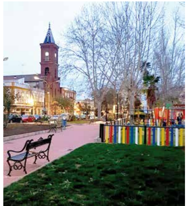
Plaza Santa Bárbara de Peñarroya-Pueblonuevo

Gracias a la Realidad Aumentada, el Ayuntamiento de Peñarroya-Pueblonuevo pretende reactivar el turismo del municipio, favoreciendo que el turismo repunte y mejore su posicionamiento como destino turístico de calidad, a