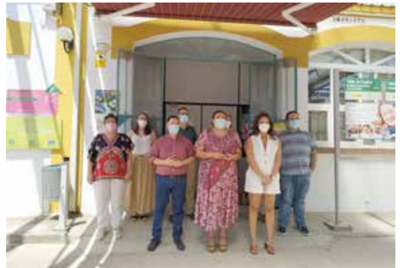
Amo informó a los alcaldes del Guadiato de las inversiones realizadas en la zona

firió, además, a la apuesta por las políticas sociales, "que se han seguido incrementando alcanzando los 68,95 millones de euros en 2021 y que se sitúan en más del doble de lo que se destinaba en 2015".