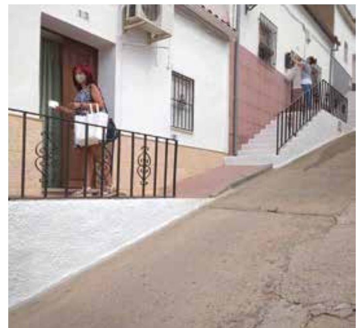
Reparto de mascarillas en Villaharta

Por lo que respecta a la hostelería, aforo máximo del 50% en el exterior, mesas de hasta 6 personas, no permitido consumo en barra, ni actuaciones musicales, ni baile, horario de cierre a las 02,00h.