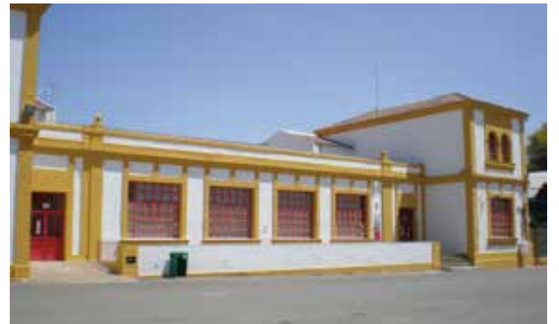
Educación va a reformar las instalaciones del IES José Alcántara

La contratación de estas obras se ha realizado a través del nuevo Acuerdo Marco puesto en marcha por la Agencia Pública Andaluza de Educación, que permite agilizar los plazos de