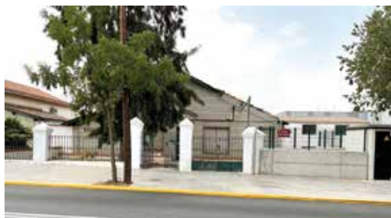
Estado actual de las instalaciones de Fray Albino

Una vez que se produzca la finalización de estas obras, y el traslado de dichos servicios